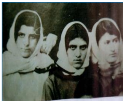
Первые выпускницы 3 девушки - горянки