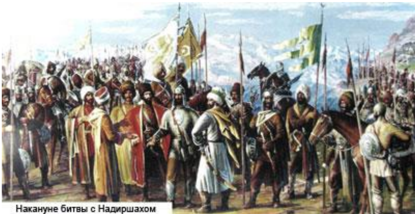
Накануне битвы с Надиршахом